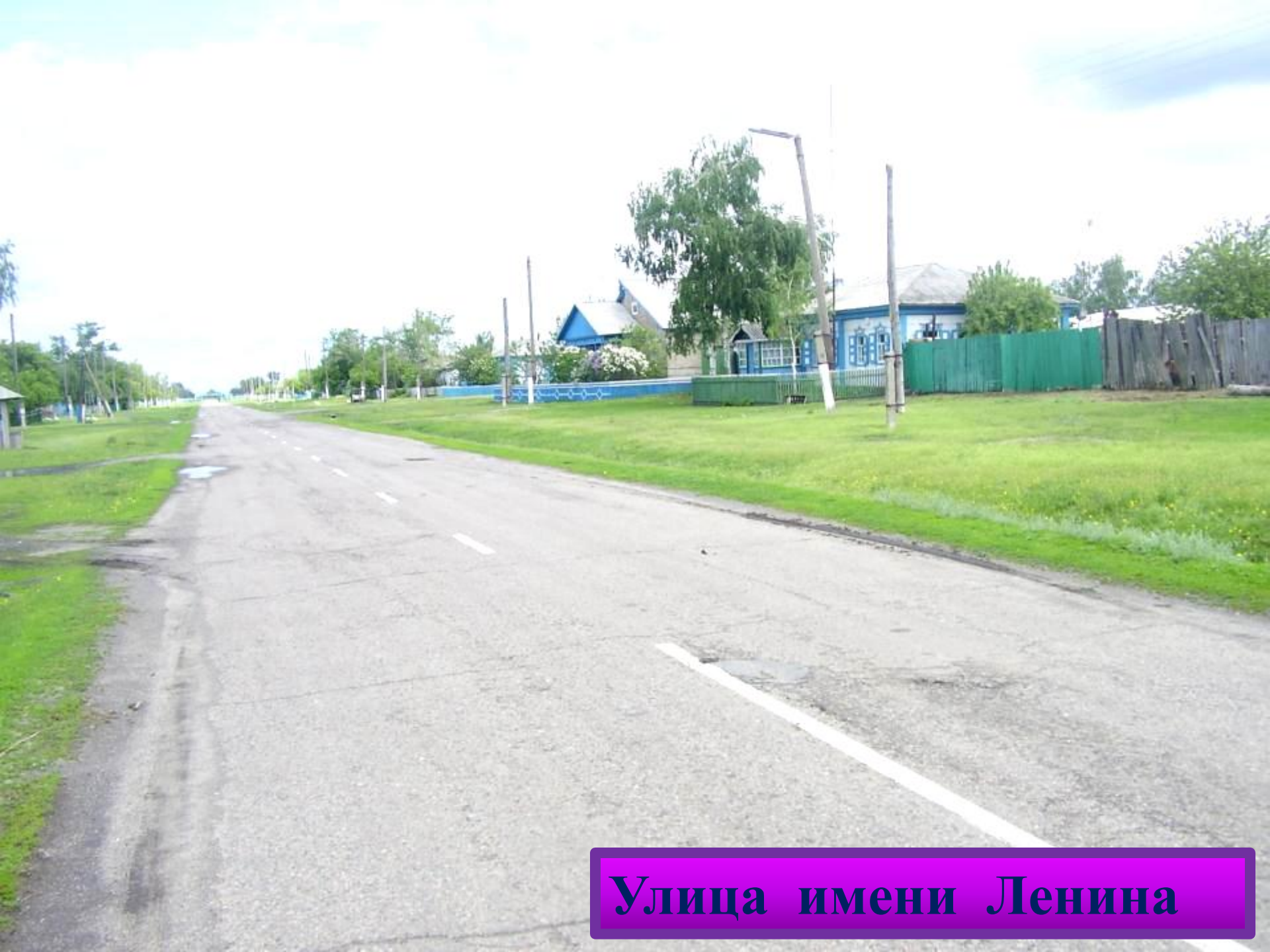
Улица имени Ленина